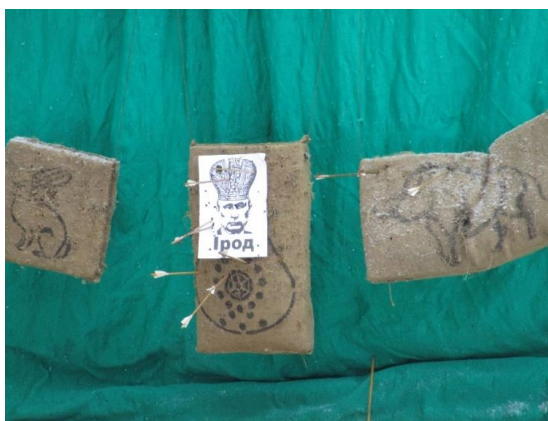
Figura 10 – Feira com alvos para atirar flexas no presidente russo Wladimir Putin