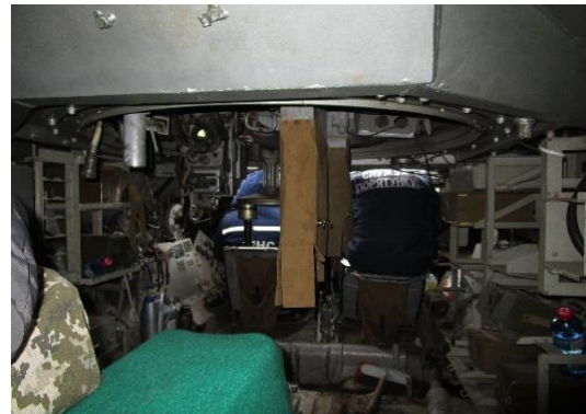
Figura 2 – Interior do tanque de guerra