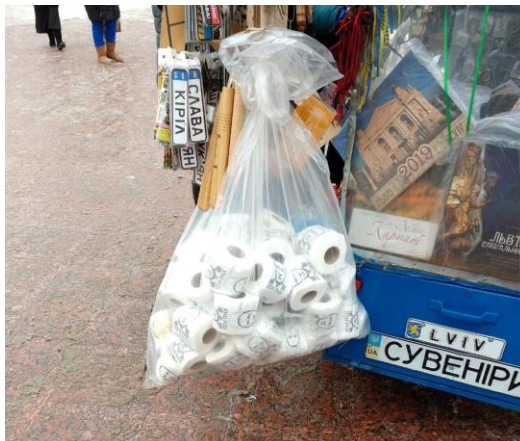
Figura 6 – Material satirizando o presidente russo Wladimir Putin

cenar demonstram a popularização das tentativas de moldar a opinião pública em favor de determinada posição política.