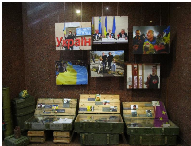
Figura 5 – Museu em memória do Holodomor