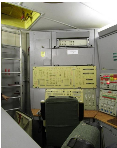
Figura 4 – Passeio em antiga base de mísseis nucleares