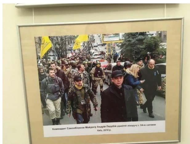
Figura 6 – Museu em memória do Holodomor