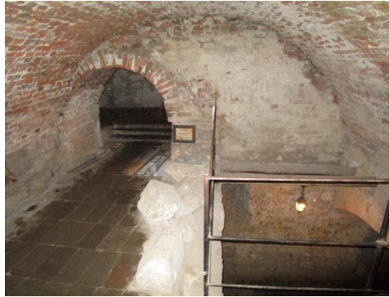
Figura 11 – Igreja lacrada nos tempos soviéticos