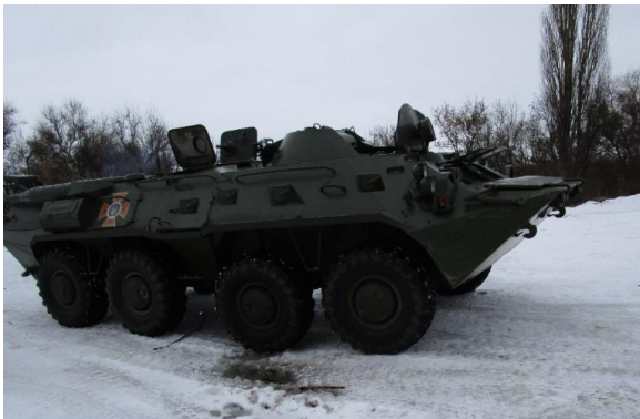
Figura 1 – Passeio em tanque de guerra

Em Kiev, parte da população subsiste do turismo de passeios exóticos, como andar e dirigir tanques de guerra (Figuras 1 e 2), manuseio de armas de grande poder de fogo (Figura 3) e até passeios em antigas bases de mísseis nucleares (Figura 4).