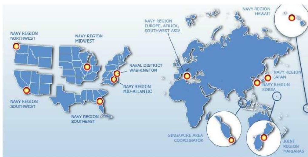
Figura 3 – Regiões Navais dos EUA