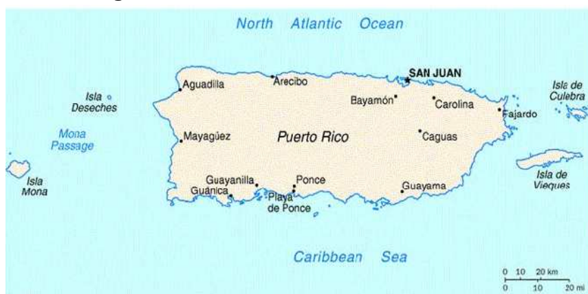
Figura 1 – O Estado Livre Associado de Porto Rico