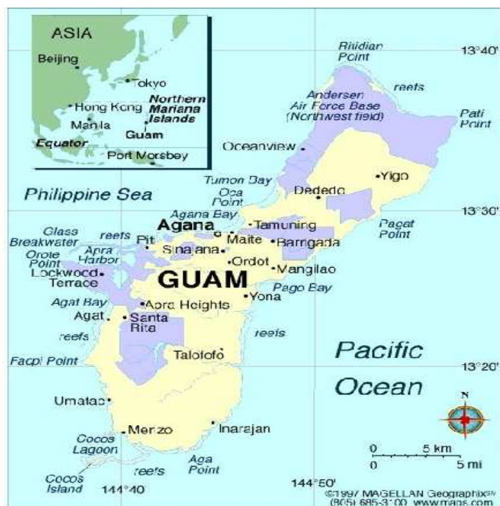
Figura 2 – A Ilha de Guam